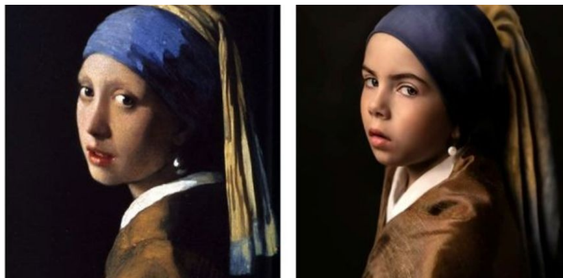
Przykładowa praca - źródło: https://gazetaolsztynska.pl/pisz/648145,quotZywe-obrazy/